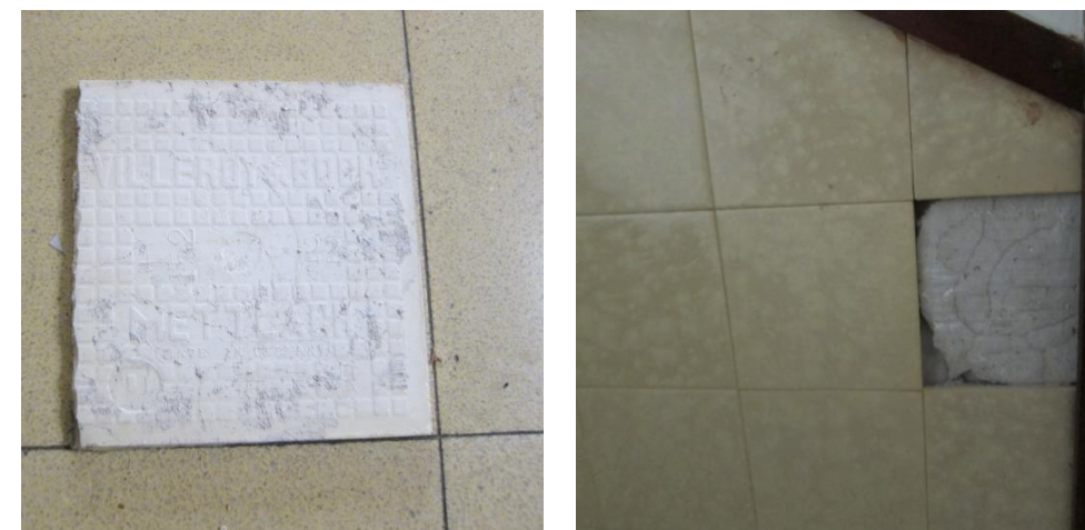
אריחי קרמיקה מתוצרת המפעל הגרמני VILLEROY & BOCH

המבנה תוכנן ברוח התנועה המודרנית, טייוח בטיח חלק ונצבע בצבע בהיר, מאופק ומינימליסטי. הבניין נבנה בעמודים וקורות כשקירות הבניין משמשים לו מילואה, המרפסות השקועות במסת המבנה מדגישות את עצמאות השלד ביחס למיקום הפתחים בקירות ("תכנית חופשית"), הבניין חף מעיטורים ומתוכנן בקפידה. החזית הראשית תוכננה בעזרת פרופורציות של חתך הזהב וניכרת שלמות בחזית לרחוב.